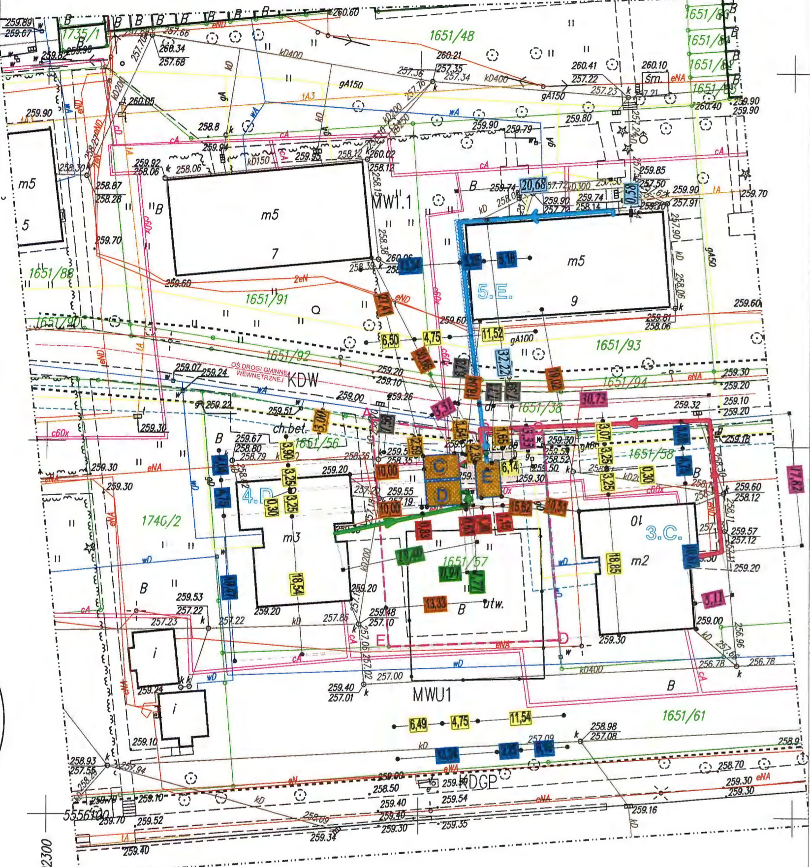
Legenda do Miejsowego Planu Zagospodarowania Przestrzennego zatwierdzonego Uchwałą nr XXXVII/458/2017 Rady Miejskiej w Krzeszowicach z dnia 23 listopada 2017 r. w sprawie miejscowego planu zagospodarowania przestrzennego miasta Krzeszowice

MWU1 – tereny zabudowy mieszkaniowej wielorodzinnej i usługowej, MW1.1 – tereny zabudowy mieszkaniowej wielorodzinnej, KDW – tereny dróg wewnętrznych, KDGP – droga główna pospieszna